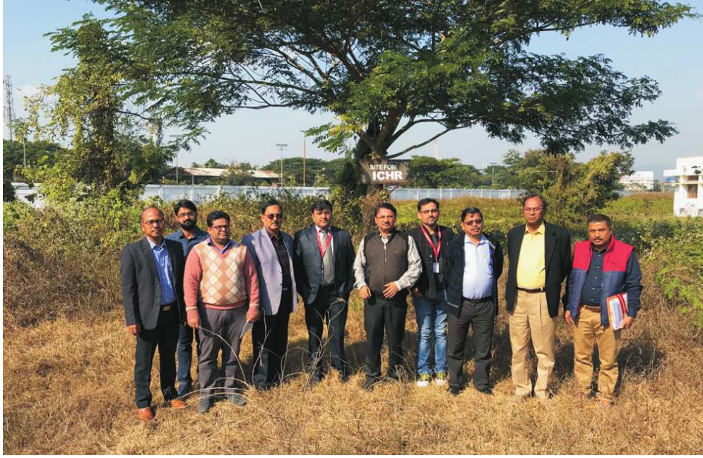
भा.इ.अ.प. के गुवाहाटी केन्द्र पर बिल्डिंग कमेटी की बैठक के दौरान गुवाहाटी विश्वविद्यालय स्थित निर्माण स्थल पर परिषद् के अधिकारी व अन्य विशेषज्ञों ने दौरा किया।