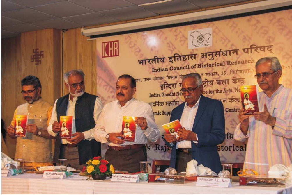
इंदिरा गांधी राष्ट्रीय कला केन्द्र, नई दिल्ली में 03 मई 2018 को आयोजित कल्हण राजतरंगिणी : ऐतिहासिक परिप्रेक्ष्य विषयक राष्ट्रीय संगोष्ठी के दौरान अभिनव गुप्त विषयक पुस्तक का विमोचन करते मंचासीन अतिथिगण।