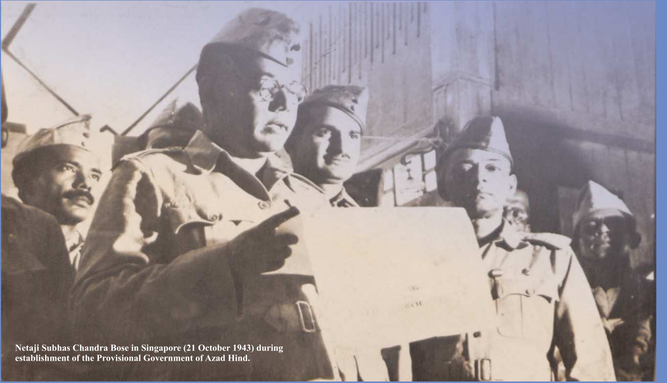
Netaji Subhas Chandra Bose in Singapore (21 October 1943) during establishment of the Provisional Government of Azad Hind.