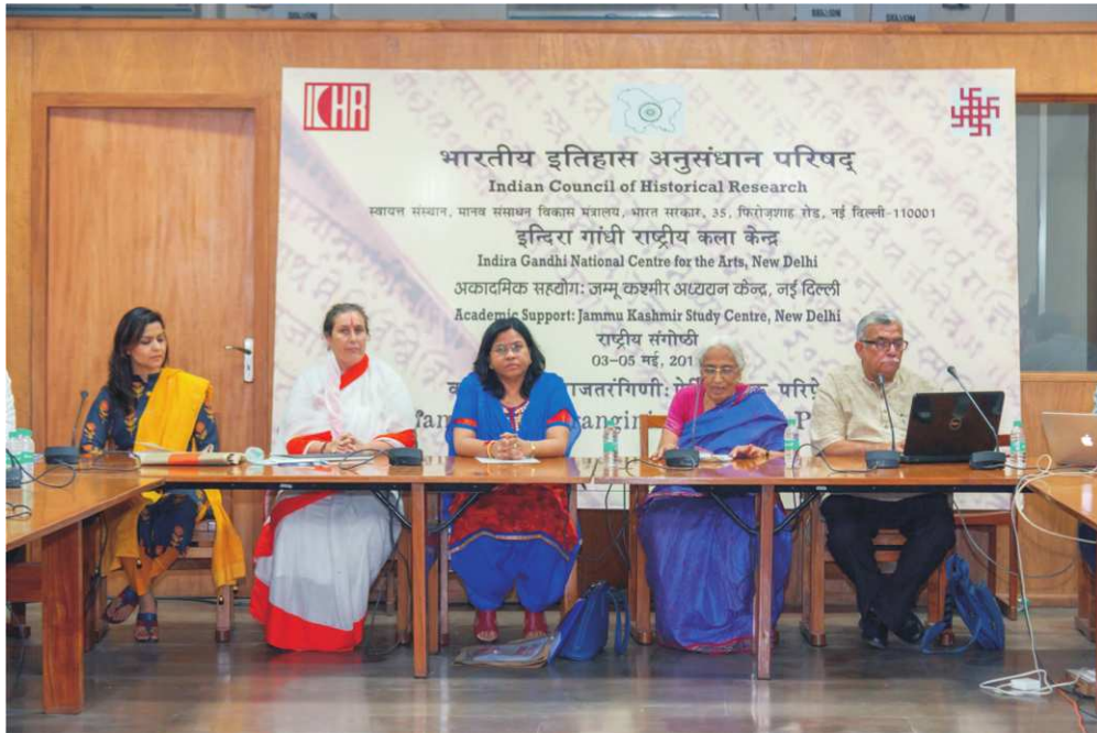
इंदिरा गांधी राष्ट्रीय कला केन्द्र, नई दिल्ली में 03 मई 2018 को आयोजित कल्हण राजतरंगिणी : ऐतिहासिक परिप्रेक्ष्य विषयक राष्ट्रीय संगोष्ठी के दौरान विषय पर चर्चा करते शोधार्थी व अन्य।