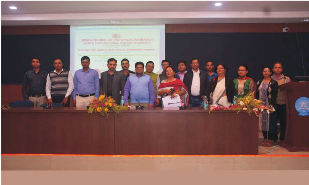
गुवाहाटी विश्वविद्यालय में 3-4 फरवरी 2019 के दौरान हिस्ट्री ऑफ नार्थ ईस्ट इंडिया : उभरती प्रवृत्तियाँ विषयक राष्ट्रीय संगोष्ठी के दौरान भा.इ.अ.प. के अधिकारी, शोधार्थी व अन्य।