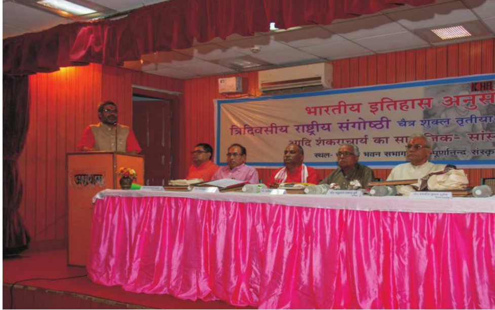
सम्पूर्णानन्द संस्कृत विश्वविद्यालय, वाराणसी में 3-5 अप्रैल 2018 को आयोजित 'आदि शंकराचार्य का सामाजिक-सांस्कृतिक प्रभाव : ऐतिहासिक परिप्रेक्ष्य' विषयक संगोष्ठी के दौरान सदस्य सचिव, भा.इ.अ.प., नई दिल्ली संबोधित करते हुए व मंचासीन अतिथिगण।