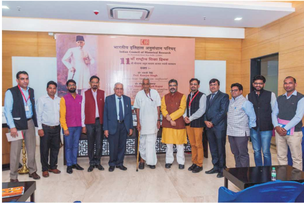
11वें राष्ट्रीय शिक्षा दिवस के आयोजन मौके पर 15 नवम्बर 2018 को कंस्टीट्यूशन क्लब में उपस्थित भा.इ.अ.प. के सदस्य सचिव, माननीय अतिथिगण व अधिकारी गण।