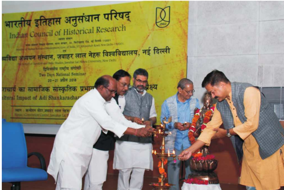
जवाहरलाल नेहरू विश्वविद्यालय, नई दिल्ली में 20-21 अप्रैल 2018 को आयोजित 'आदि शंकराचार्य का सामाजिक-सांस्कृतिक प्रभाव : ऐतिहासिक परिप्रेक्ष्य' विषयक राष्ट्रीय संगोष्ठी के दौरान मुख्य अतिथि तथा अन्य अतिथिगण दीपप्रज्वलन करते हुए।